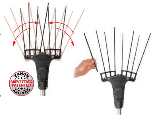
Bacchette in carbonio di facile e rapida sostituzione Easy and quick replacement carbon rods Dientes de carbono con sistema de cambio fácil y rápido